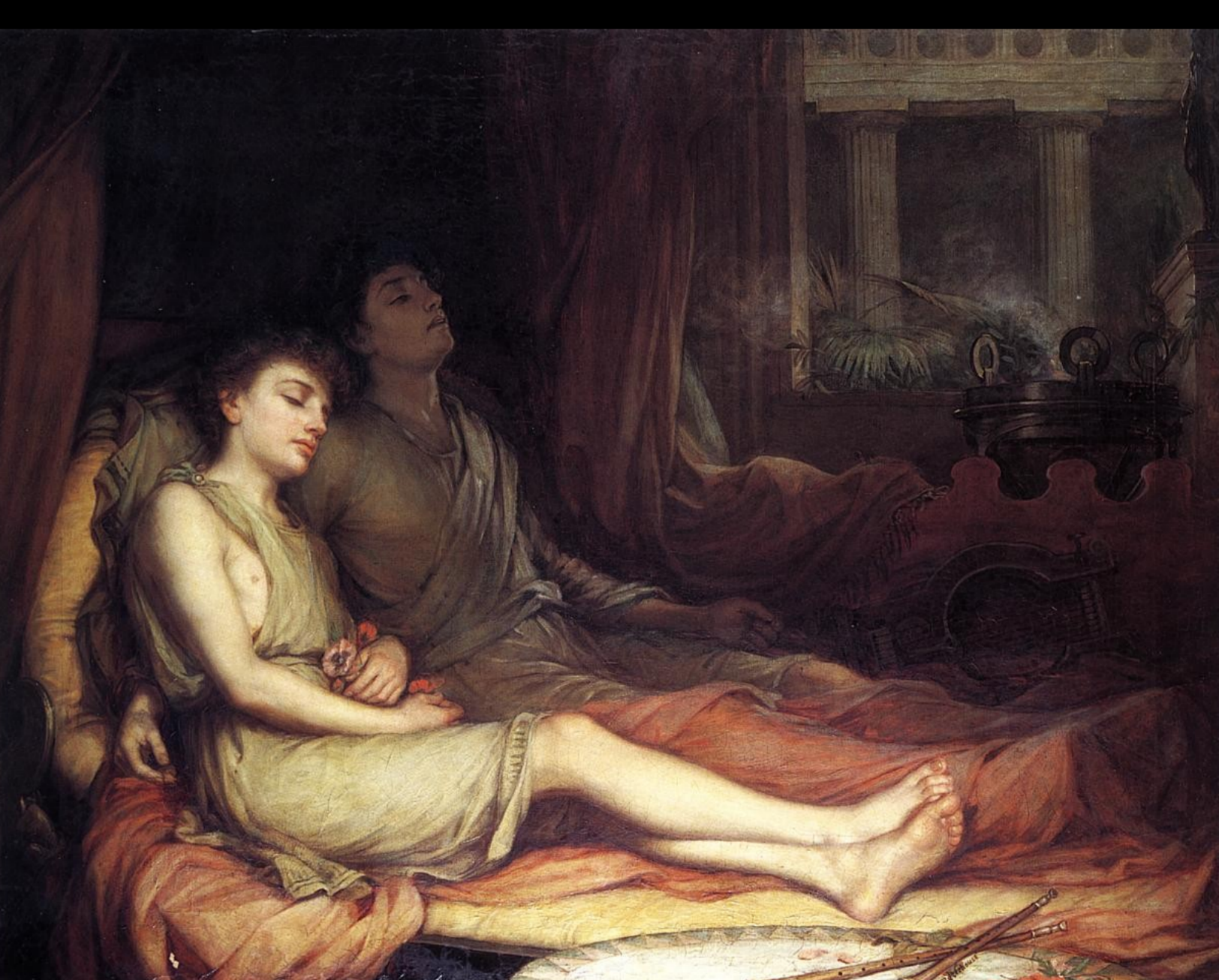
Hypnos y Thanatos, John William Waterhouse, 1874.