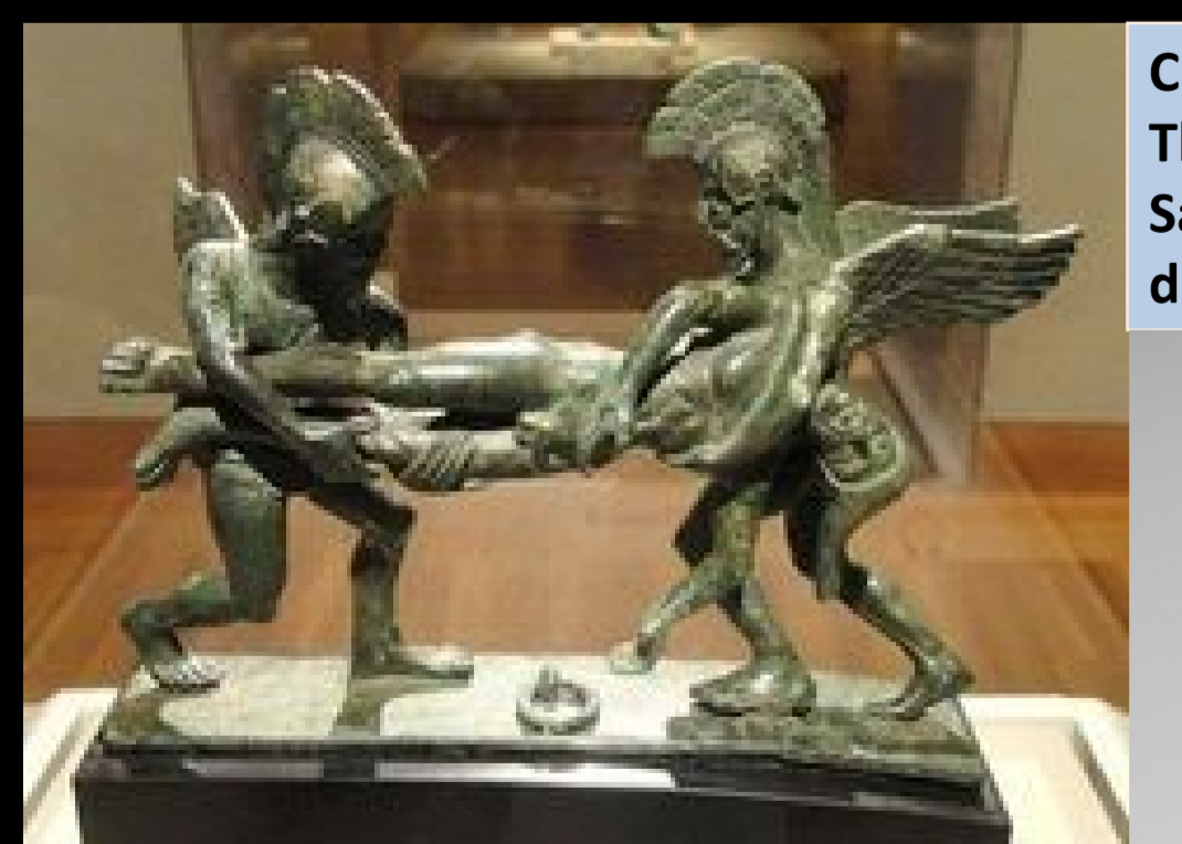
Cista lustral etrusca, con Hypnos y Thanatos llevándose el cuerpo de Sarpedón, 400-375 a. de C. Museo de Cleveland, inv. 1945.13

El proceso de helenización de Etruria fue tan intenso, que el mito de Hypnos y Thanatos llevándose a Sarpedón fue asimilado y representado de forma idéntica o transformado en una variante que presenta a los dioses esposos Manía y Mantus, llevándose al muerto al inframundo.