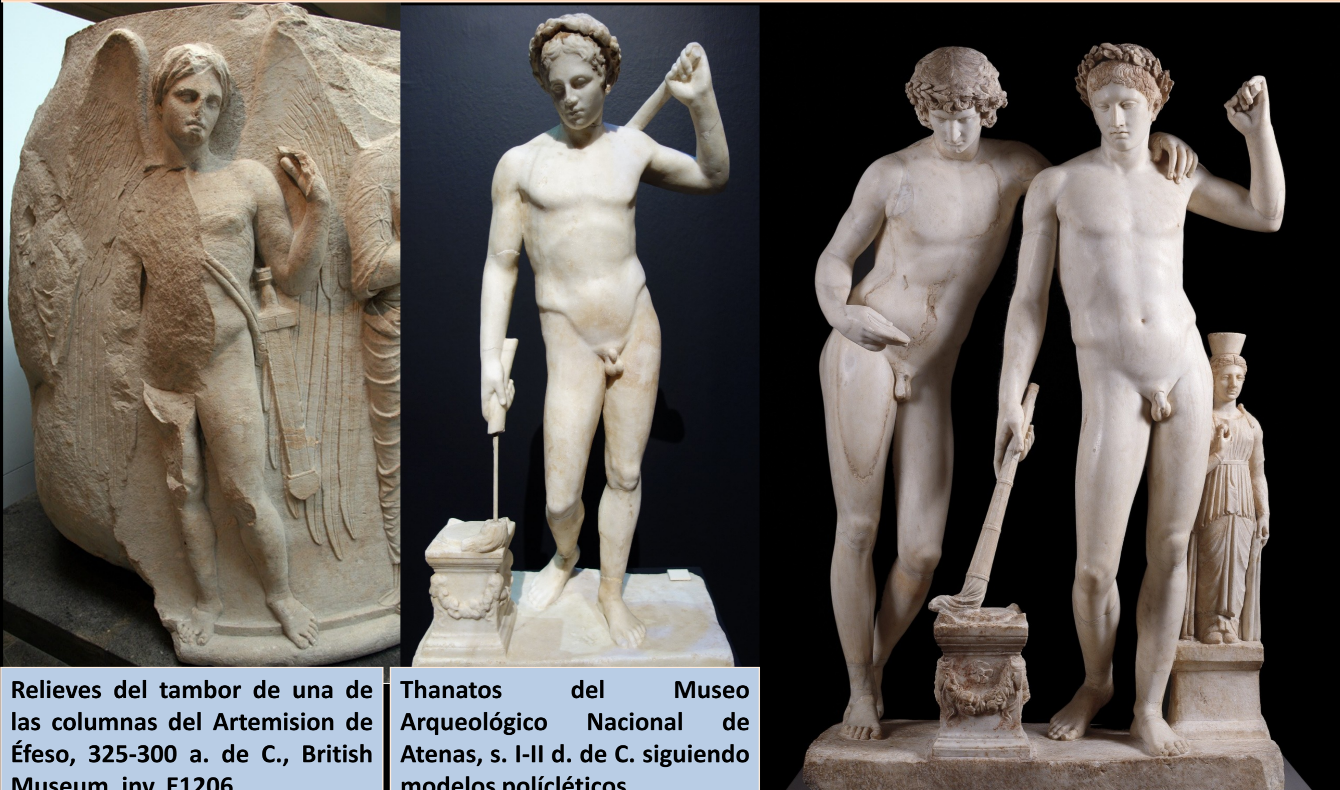
Relieves del tambor de una de las columnas del Artemision de Éfeso, 325-300 a. de C., British Museum, inv. E1206.

Tipo V: A partir del siglo V a. de C. Thanatos empezó a ser visto como un dios cuya ira había que aplacar para que la vida fuera más duradera. Se le representa como un efebo, con una antorcha invertida acercándola a un altar para apagarla (símbolo del fin de la vida) y una espada envainada y colgada de un cinturón para no confundirlo con Eros cuyo atributo es el arco y el carcaj.