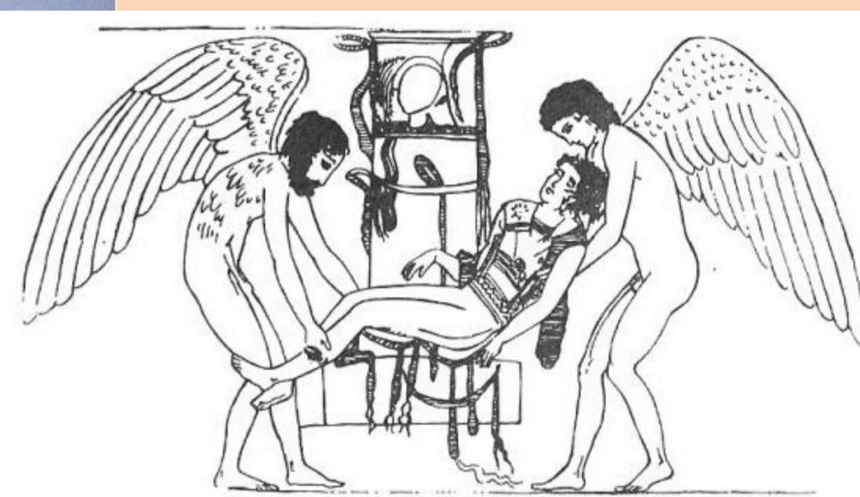
Lecitos del Museo Británico atribuido al pintor de Thanatos, ejecutado hacia el 430-420 a. de C., inv. D58

Tipo IV: Presenta el túmulo sobre el que se van a hacer las honras fúnebres, en el momento en que Hypnos y Thanatos depositan el cadáver de Sarpedon. Del monumento funerario se reconocen perfectamente los escalones del fundamento, el pilar de sección cuadrada, el capitel y las ofrendas dispuestas (cintas, casco corintio...).