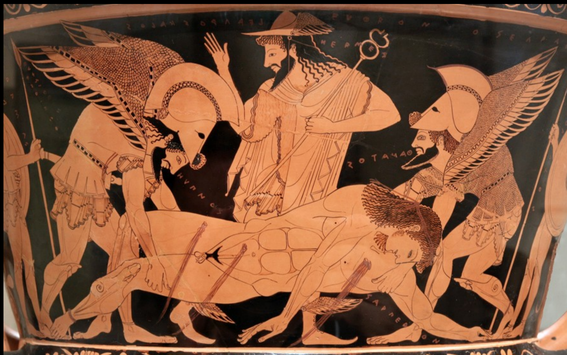
Crátera ática de figuras rojas firmada por el alfarero Euxiteo y el pintor Eufronio, ejecutada hacia el 515 a. de C. Las inscripciones identifican a Hipnos, Thanatos, Hermes y Sarpedón, Metropolitan Museum of Art, New York inv. 1972.11.10.

Hypnos y Thanatos están íntimamente relacionados con los dioses del destino y la muerte. A Thanatos se le ha adjudicado ser dios de la muerte heroica, acontecida en la plenitud de la juventud. Su hermana, Ker, es la diosa de la muerte violenta, compañera inseparable de Ares. Las Keres, en plural serían los espíritus femeninos de la muerte con violencia, diferenciados de las Moiras, que son las diosas del destino: Cloto, Láquesis y Átropo, que corta el hilo de la vida y con ello causa la muerte. De la relación de Hypnos con Pasitea nació la tribu de los sueños y pesadillas: Oniros , entre los que están Morfeo, Fobetor, Fantaso...