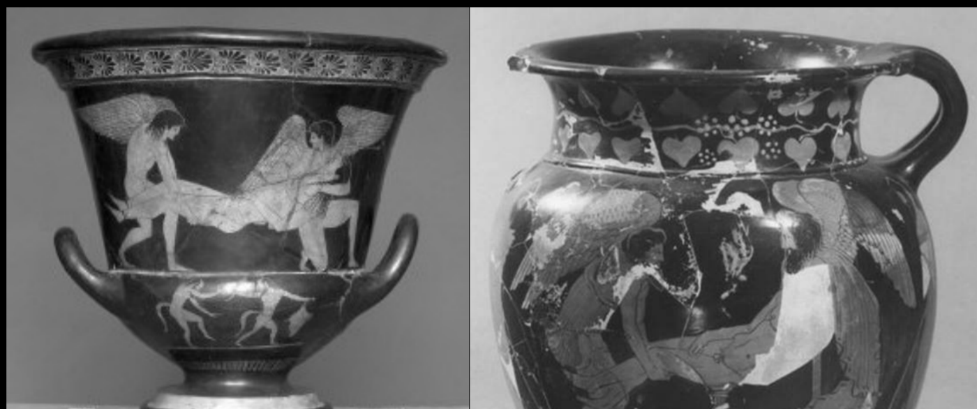
Crátera ática atribuida al pintor Eucárides, 490-480 a. de C. Museo del Louvre, inv. 6163. Aríbalo ático atribuido al pintor Dinos, 430-420 a. de C. Museum of Liverpool, inv. 50.43.12. 6163.

Tipo I: Se representan a los hermanos Hypnos y Thanatos desnudos o vestidos como hoplitas (soldados de tierra), alados, llevándose el cadáver de Sarpedón, en composición en paréntesis