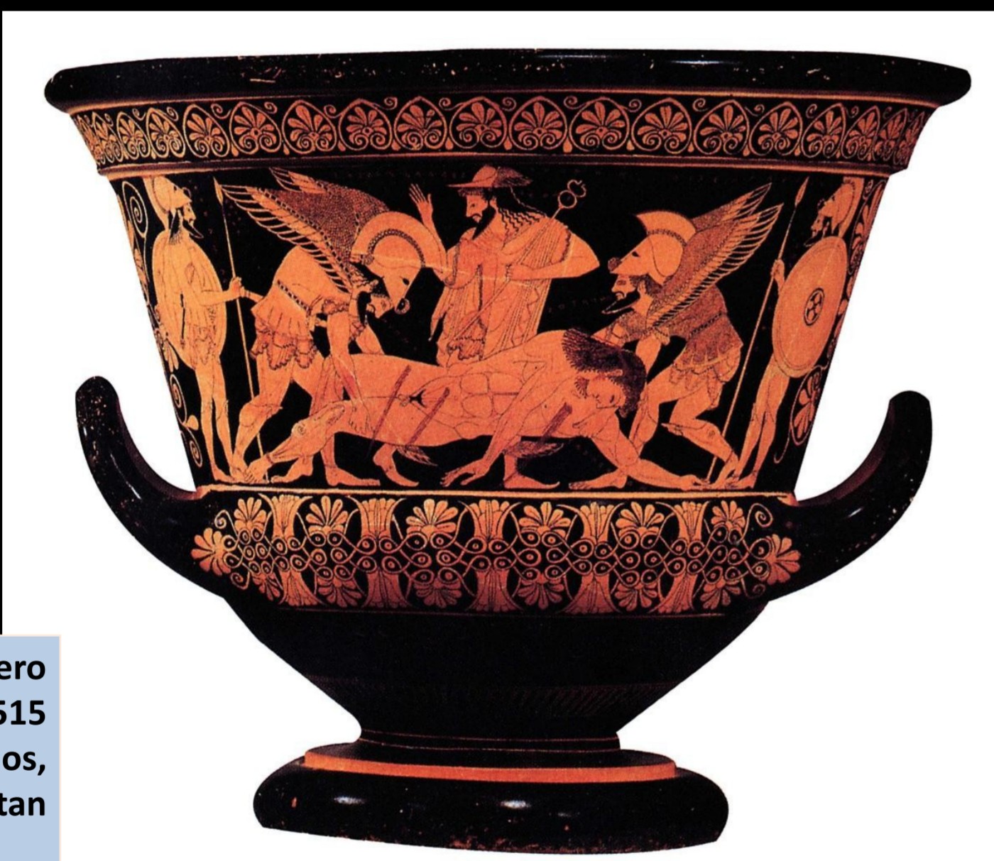
Crátera ática de figuras rojas firmada por el alfarero Euxiteo y el pintor Eufronio, ejecutada hacia el 515 a. de C. Las inscripciones identifican a Hipnos, Thanatos, Hermes y Sarpedón, Metropolitan Museum of Art, New York inv. 1972.11.10.

Tipo II: Sobre la variante anterior se añade la representación de Apolo y Hermes como dioses implicados en el traslado del alma al más allá y en ocasiones la de otros hoplitas.